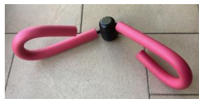
Bein- und Armtrainer 3 € pro Stück

Bei Interesse gerne bei der jeweiligen Kursverantwortlichen/beim jeweiligen Kursverantwortlichen melden.