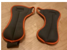
Kettler Gewichtsmanschetten – je 1,5 kg 5 € pro Paar